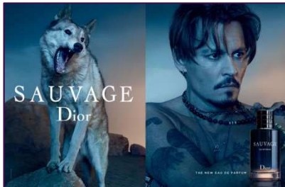
DIOR Sauvage EdP