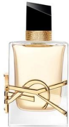
YVES SAINT LAURENT Libre