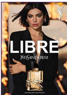
YVES SAINT LAURENT Libre