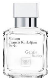
MAISON FRANCIS KURKDJIAN Gentle Fluidity Silver