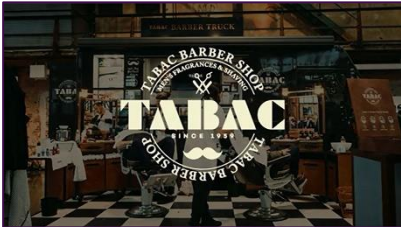
TABAC Barber Truck