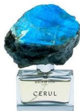
BERLIN DE VOUS Cerul