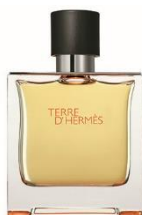
HERMÈS Terre D'Hermès Pure Perfume